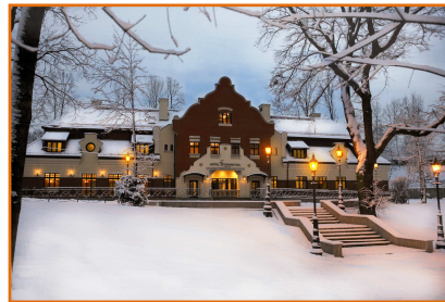
Hotel Grand Sal**** w Wieliczce